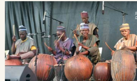
Les Tambours qui parlent

La vie dans une maison de retraite, ça coule doucement, jusqu'à ce que...! Avec subtilité, le collectif questionne les tabous autour des p'tits vieux et cherche par le rire et le jeu masqué à parler de l'intime.