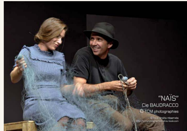
"NAÏS" Cie BAUDRACCO

Dans cette histoire inspirée d'un conte traditionnel, les deux héros veulent comprendre pourquoi la rivière qui fait vivre leur pays s'assèche. Ils découvrent qu'une bête féroce terrorise la contrée voisine : elle dévore les jeunes gens et s'accapare l'eau. Ils sont déterminés à tout faire pour défendre la précieuse ressource.