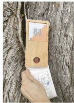
Exemple de balise à poinçonner

*3 parcours sont à votre disposition sur la commune : - Le secteur du Poinleau et son prolongement sur la promenade bord de mer en direction de Saint-Brevin. - Le quartier de Mindin - La pointe de l'Imperlay