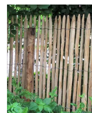
Ganivelles en châtaignier

La clôture constitue l'image première de la villa. Elle doit être traitée en référence à celle-ci d'une part, et en référence à l'environnement et au quartier d'autre part.