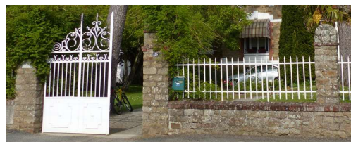
Muret surmonté d'une grille