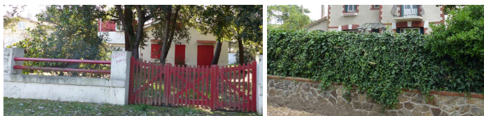
Murets surmontés de dispositifs à claire-voies (en harmonie avec la construction)