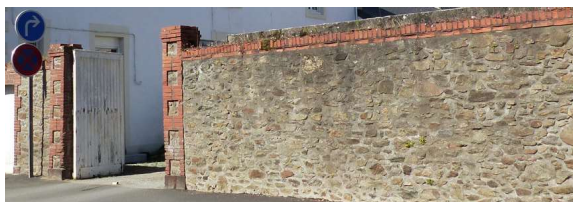
Mur en pierre