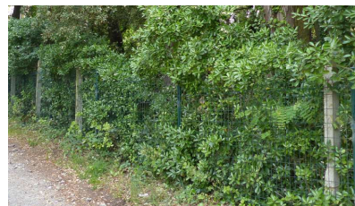
Grillage doublé d'une haie d'essences variées