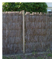
Brande toute hauteur sur poteaux bois